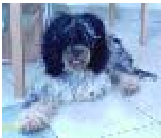
... so sah ich vor dem Friseurbesuch aus ...