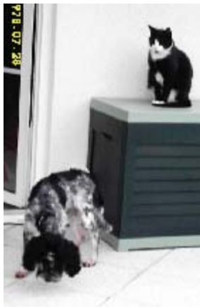
... Katze Moritz ist ganz schön neugierig...